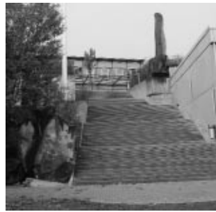
Kunst im öffentlichen Raum auf Gemeindeebene: Franz Eggenschwiler «Balsthaler Treppe», die anlässlich der Erweiterung des Schulhauses Falkenstein realisiert wurde.

Gerade bei Gegenwartskunst ist es schwer, eine einheitliche Meinung über die Qualität eines Kunstwerks zu finden. Moderne Kunst ist oft erklärungsbedürftig und löst nicht selten negative Reaktionen in der Öffentlichkeit aus. Nicht zuletzt aus diesem Grund wird von kommunalen Gremien lieber auf die Integration von Kunst verzichtet, als sich der Kritik auszusetzen. Deshalb