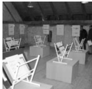
Impression von der Übergabefeier in der Waldeggscheune, 22. Oktober 2003.