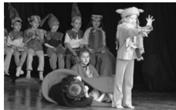
Eindrücke von der Schultheaterwoche 2004 auf Schloss Waldegg. Die von Werner Panzer, Theaterschaffender und Theaterpädagoge aus Solothurn, durchgeführte Schultheaterwoche ist seit Jahren ein herausragendes Beispiel für die Verbindung von Bildung und Kultur. Sie wird vom Kantonalen Kuratorium für Kulturförderung mit einem namhaften Beitrag unterstützt. ■