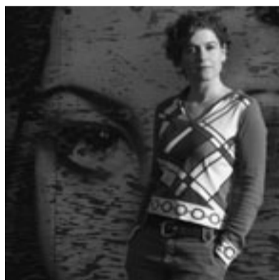
SABINA BOBST Fotografin

foyer wollte von den Empfängerinnen und Empfängern der Werkjahrbeiträge 2004 wissen, was für sie der Werkjahrbeitrag persönlich bedeutet, welche Perspektiven er eröffnet und was eine solche Förderung jungen Künstlerinnen und Künstlern generell nützen kann.