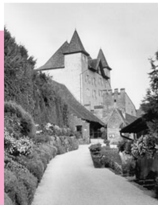
Aarau; Schlossgärtnerei Steiner, Nd. Gösgen; Wöschtruhe, Olten)

Freitag 3. – Sonntag 5. September Zauberhafte Herbstsinfonie auf Schloss Wartenfels, mit Regionalen Firmen (Prantl,